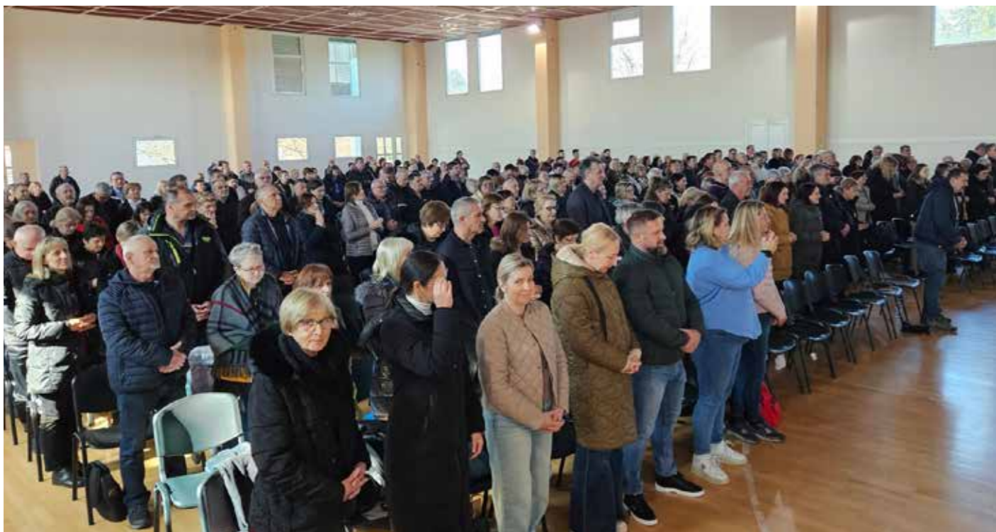
DUHOVNA OBNOVA ZA BRANITELJE I ČLANOVE NJIHOVIH OBITELJI U MEĐUGORJU