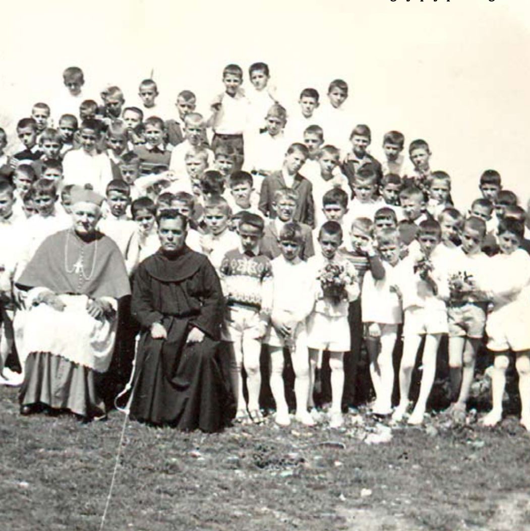
Krizma u Međugorju prije pedeset godina