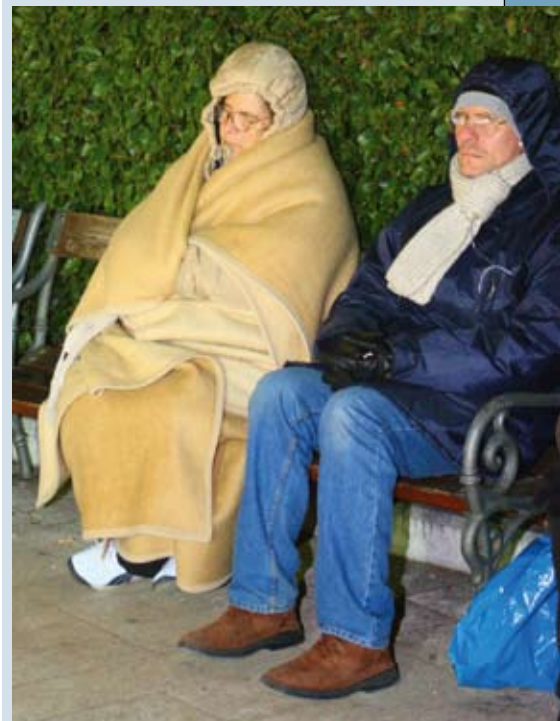
Crkva, dvorana i šator bili su prepuni - novogodišnje bdjenje ispred crkve.

Poslije Mise, mladi su se pred crkvom zadržali duže vremena u pjesmi i plesu.