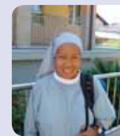
S. Maria Veronica, Italija

Ovdje sam sa svojom majkom i sinovima, koji danas ministriju na engleskoj Misi. Moja majka toliko voli Međugorje, da je ovdje kupila stan, tako da već šest godina dolazimo svake godine. Osjećamo da se na nas izljeva velika milost. Ovdje napunimo svoja srca milošću, vratimo se kući i podijelimo svoje iskustvo drugima. Uvijek se popnemo na Brdo ukazanja i na Križevac i idemo do Raspetog Isusa. Znamo da je to što se tu događa istina. Uvijek smo blagoslovljeni Božjom milosti, pogotovo kad možemo biti na ukazanjima. Zahvalni smo Bogu Ocu i Duhu Svetomu što su nam poslali Majku Mariju, da bismo se ovdje s njom zbližili, da bi nas ona dovela k Isusu.