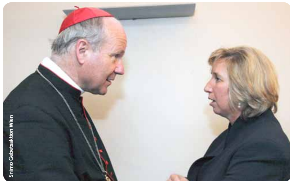
Snimo Gebetsaktion Wien

Kaže se da Gospa uvijek dolazi u ključnim trenucima. Ovdje se predstavila imenom Kraljica Mira. Točno deset godina poslije, kada je počeo rat ovdje na našim prostorima, mi smo razumjeli zašto. Točno trećega dana ukazanja Gospa je plakala. Iza njezinih leđa bio je taman križ. Rekla je: „Mir, mir, mir, mir između čovjeka i Boga!“ Mnogo smo se puta pitali što znači ta poruka. Počeli smo pozivati sve ljude neka se pomiruju u obitelji, s osobama s kojima su u sukobu, jer je to Gospa tražila. Čuli smo mnoga svjedočanstva ljudi koji su bili u međusobnom sukobu, koji su se smirili i pomirili. Gospa se ipak nije zaustavila na tome. Hoće nešto više. Rekla je da se molitvom i postom mogu i ratovi ukloniti. To smo iskusili, napose kada je počeo rat ovdje na Balkanu. Dobro se sjećam svjedočanstva