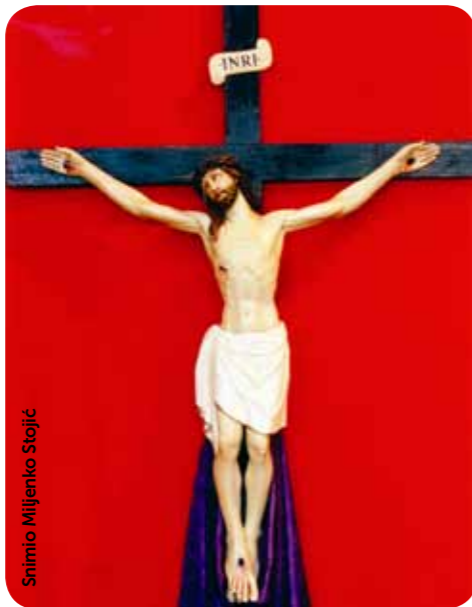
Raspelo, rad pučkog majstora

Ne da mi se govoriti što bismo sve trebali popraviti u svome životu. Umjesto toga napravimo sljedeće. Jednostavno razmislimo o svemu. I past će nam na pamet gdje smo sve „tanki“. Što više budemo gledali u križ, bistririt će nam se pogled i bivati će nam jasnije što nam je činiti. U suprotnom, ne će nam pomoći nikakve riječi. Bit će to samo poput mnoštva vijesti kojima nas svednevice obasiplju, ali na sredini ništa. Nismo shvatili zbog čega se nešto događa, tko je glavni uzročnik, kad će to prestati. Zapravo, sve je poslužilo samo da nas zavara, i to je to. Zbog toga napustimo način ponašanja odmaranja pred televizorom i gutanjem, često