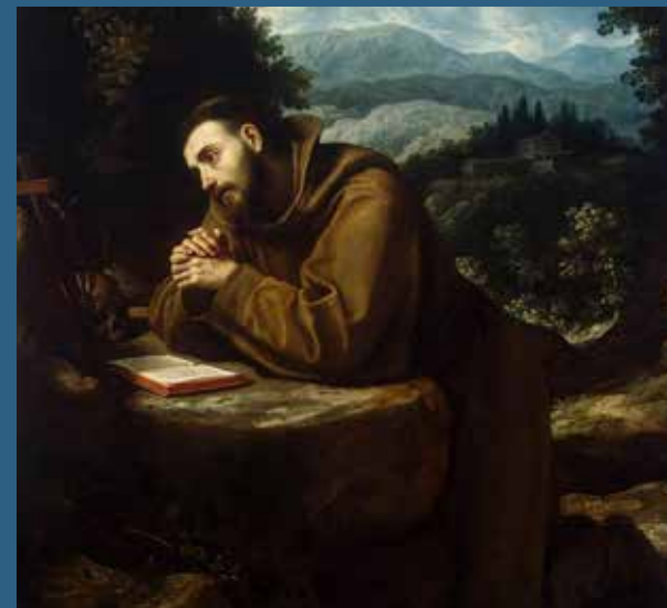
Fotografija na naslovnici. Lodovico Cigoli, Sveti Franjo