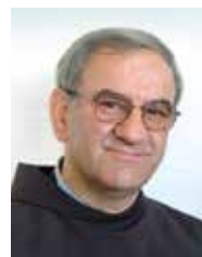
FRA TOMISLAV PERVAN

Kad se danas rabi riječi 'svetac', 'svetci', 'svetost', ima to posve drukčiji prizvuk pa i sadržaj nego to bijaše u mislima i rječniku osobe koja je prvi put riječ upotrijebila, naime sv. Pavao. Za Pavla su svetci osobe koje vjeruju u Isusa Krista, koje su krštenjem preporođene, nanovo rođene na novi život, koje su povezane s Isusom Kristom živim, osobnim vezama, koje su po nasljedovanju do kraja uključene u Isusov život i transfuziju života što dolazi od Isusa.