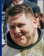
fra Antonio Musa

U svojoj prvoj enciklici, Svjetlo vjere (Lumen Fidei) , papa Franjo govori o pozivu i odgovornosti vjernika u kontekstu evangelizacije svijeta. Sveti Otač tumači kako su kršćani pozvani svjedočiti vjeru koju su sami primili po navještaju drugih. Nitko se, naime, nije rodio kršćaninom. Nitko samoga sebe nije mogao krstiti. Svakome je vjerniku Krista netko navijestio. Naš vjernički život u svome korijenu ovisio je tako o nekome drugome. Mi smo vjeru primili preko svjedočanstva i navještaja nekoga drugoga, bilo da se radilo o našim roditeljima, našim djedovima i bakama, ili bilo kome drugome. Budući da smo u svojem korijenu bili upućeni na drugoga čovjeka, i naše djelovanje u svijetu nikada nije i ne može biti individualističko, nego je uvijek usmjereno na navještanje i svjedočenje onoga što smo kao neprocjenjivi dar sami primili. Tako je to naime Crkva činila otpočetak.