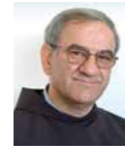
fra Tomislav Pervan

Istodobno sa završetkom Sinode o sinodalnosti papa Franjo objavio je okružnicu o štovanju Srca Isusova. Namjesto postsinodalnog dokumenta o minulim zasjedanjima sinoda Papa nudi nešto kao oporučno encikliku u kojoj ponovno potiče cijelu Crkvu na pobožnost Srcu Isusovu. Naslovljena je “Dilexit Nos” (“Ljubio nas je”). Službena prigoda je 350 godina od Gospodinovih objava i viđenja francuske redovnice od Marijina Pohoda, salezijanke Margarete Marije Alacoque (1647.-1690.). Ta su viđenja dala veliki poticaj štovanju Srca Isusova i dovela do uvođenja pobožnosti prvih petaka Presvetom Srcu Isusovu te blagdana Srca Isusova, petkom, druge nedjelje nakon Tijelova. Pio IX. godine 1856. uveo je svetkovinu koja se u početku slavila samo regionalno, a potom je proširena na cijelu Crkvu. Missale Romanum Pavla VI. iz 1970. uvrstio je svetkovinu Srca Isusova među Gospodnje svetkovine. Nakon Leona XIII. (1899.), Pija XI. Pija XII. (1956.) i Ivana Pavla II. (1980.), Franjo je peti papa koji je napisao okružno pismo o pobožnosti Presvetomu Srcu Isusovu.