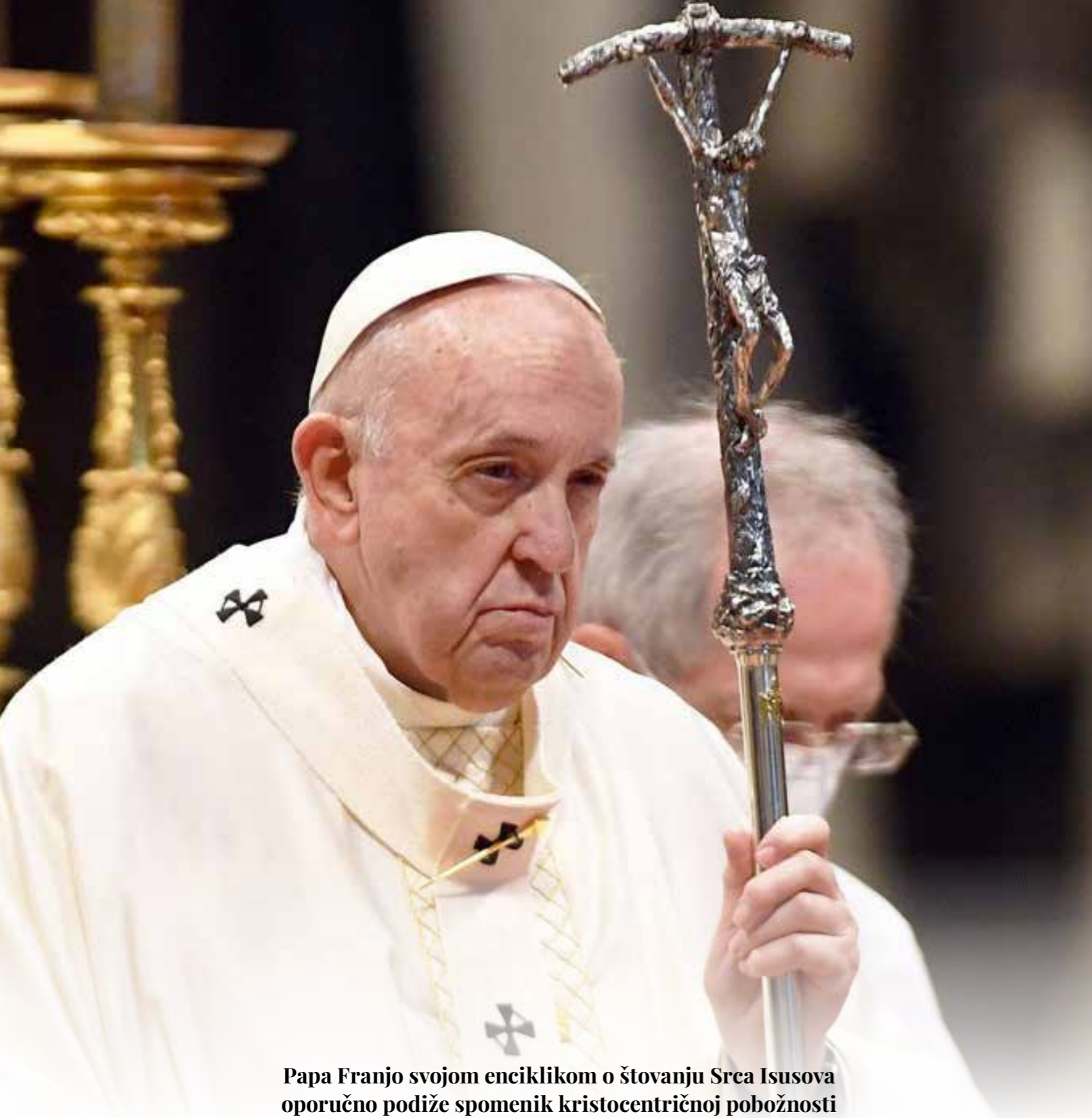
Papa Franjo svojom enciklikom o štovanju Srca Isusova oporučno podiže spomenik kristocentričnoj pobožnosti