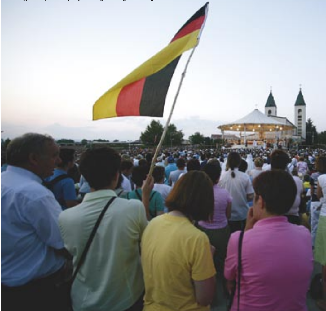
Međugorski prizori prepoznatljivi u cijelom svijetu

I ono što se podrazumijeva kad se danas kaže Međugorje moguće je protumačiti samo biblijskim kategorijama. Bog koji uvijek stvara iz ničega i koji «silne zbacuje s prijestolja, a uzvisuje neznatne» (Lk 1,52) i ovdje je po Gospinim porukama pokazao kako i danas u svijetu u kojem se slavi samo moć i veličina, najčešće nauštrb nemoćnih i malenih, on moćno djeluje upravo po malenima i neznatnima. Biblijski Bog nema kompleksa veličine i sile, niti mu je potreban savez s