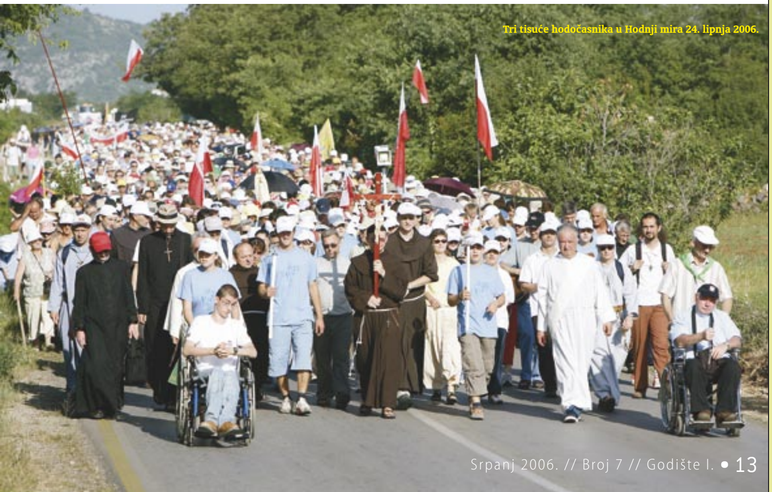
Tri tisuće hodočasnika u Hodnji mira 24. lipnja 2006.

Hodnja mira započela je molitvom i blagoslovom oko tri tisuće hodočasnika ispred >>