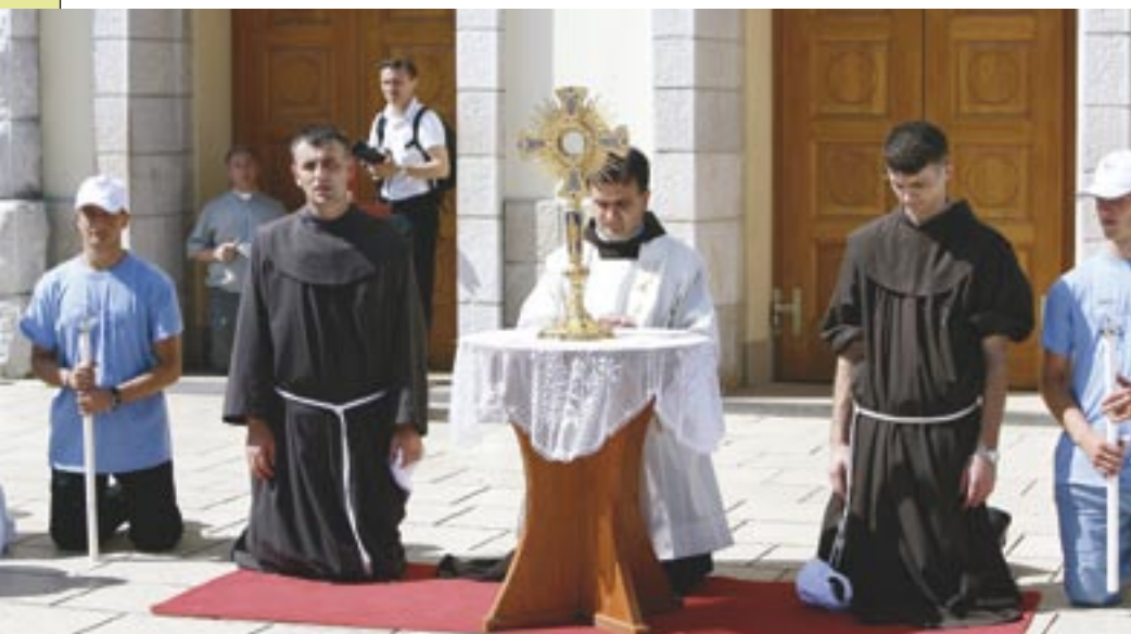
Blagoslov s Presvetim nakon Hodnje mira