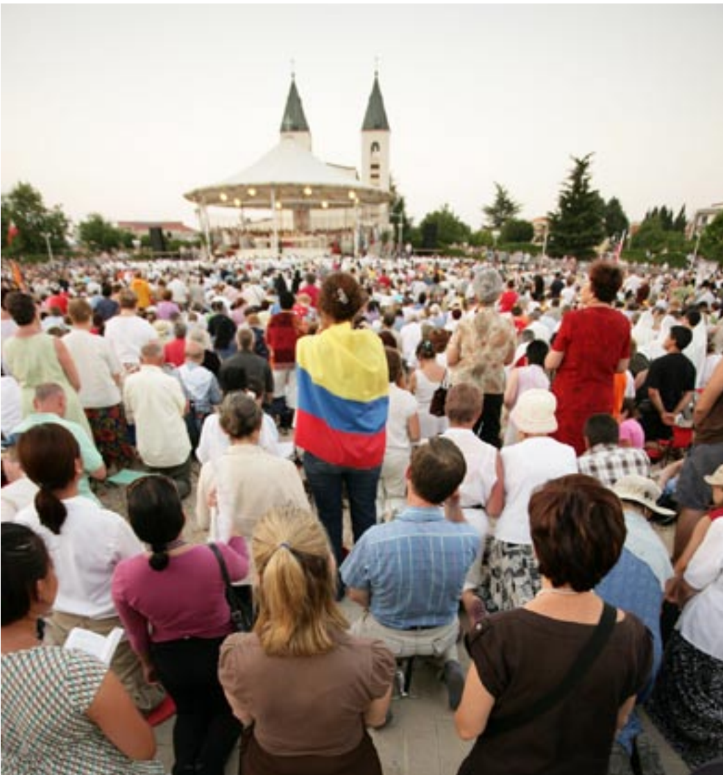
Na večernjoj sv. Misi

šalje nam Majku svoga Sina da nas dovede k sebi.