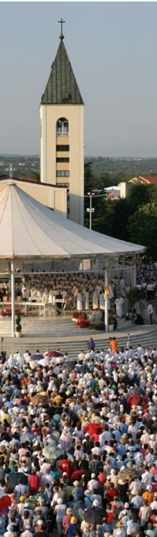
Hodočasnici svih jezika i naroda