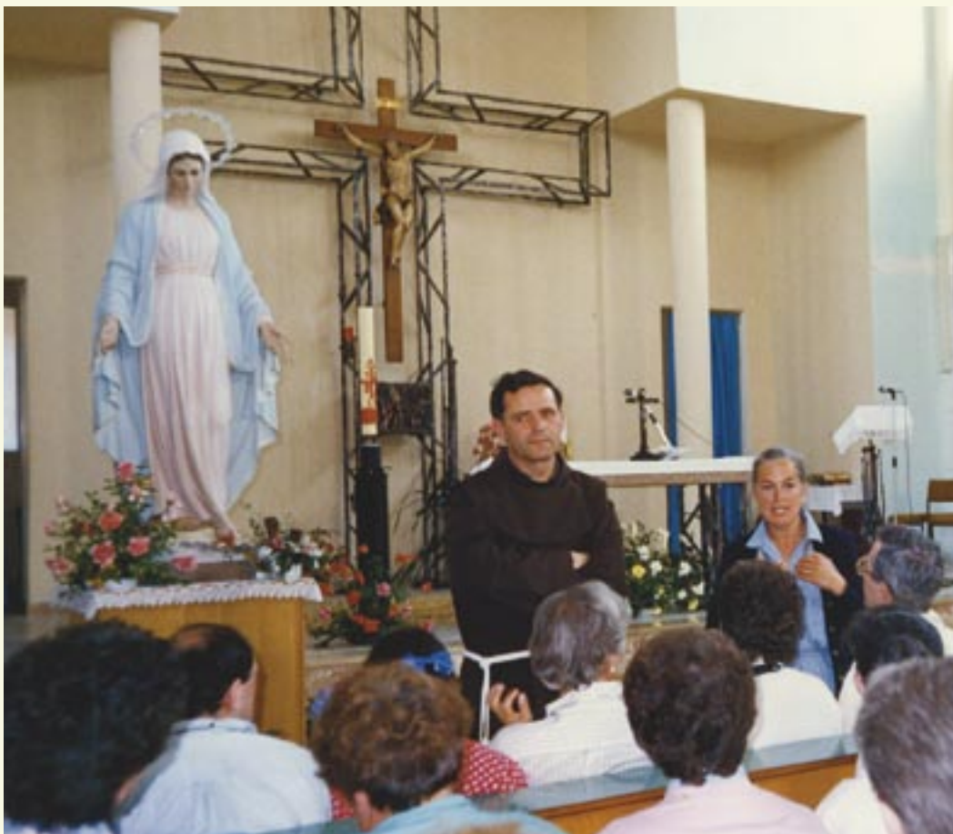
S fra Jozom u Tihaljini