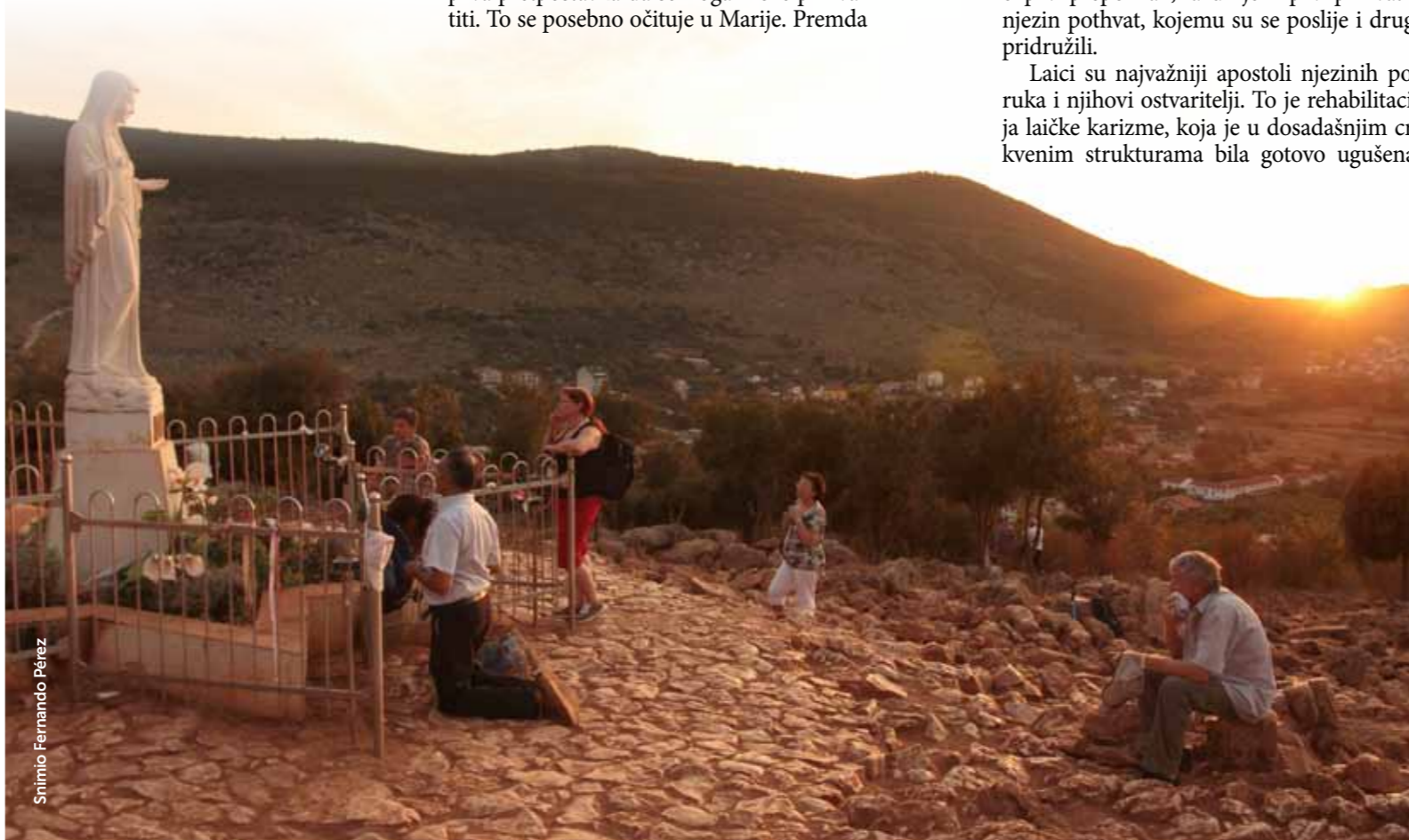
Snimio Fernando Pérez

(Iz knjige: Međugorje – vrata nebeska i početak boljega svijeta , 1999.)