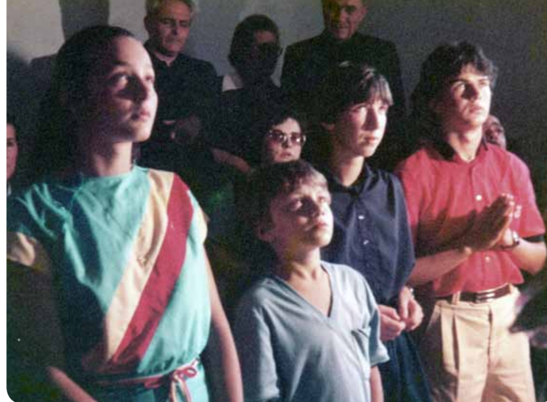
Ukazanje 24. lipnja 1983.

– Jesmo prezimenjaci, ali nismo rodbina. No, u ovom slučaju duhovna srodnost dale-