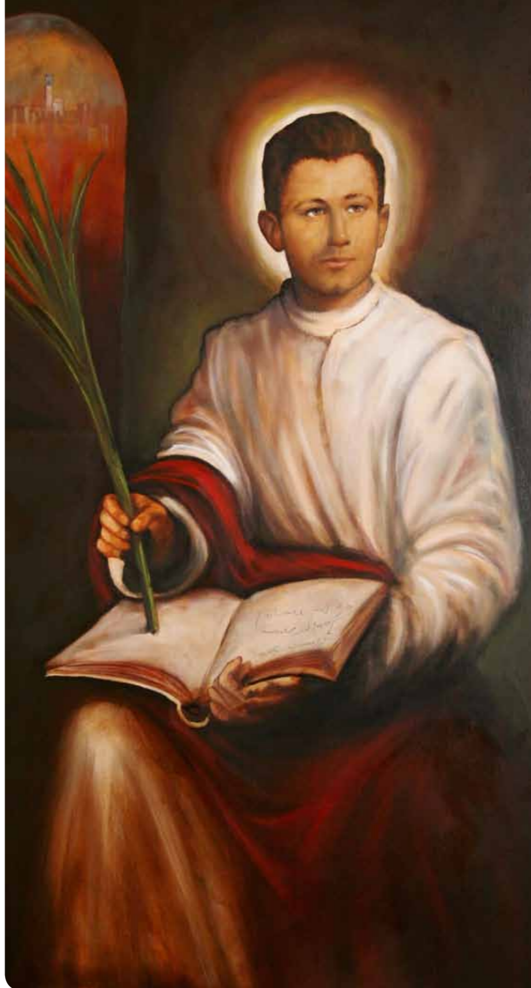
Eugen Varžić: Blaženi Miroslav Bulešić

Za beatifikaciju Miroslava Bulešića nije bilo potrebno nikakvo čudo jer je mučeništvo „najveći znak ljubavi, vjere i odanosti čovjeka prema Bogu“. „Mučeništvo pere sve nedostatke jer je krv prolivena za najviše ideale“. Raduj se Crkvo u Hrvata jer imaš još jednoga zagovornika na nebu!